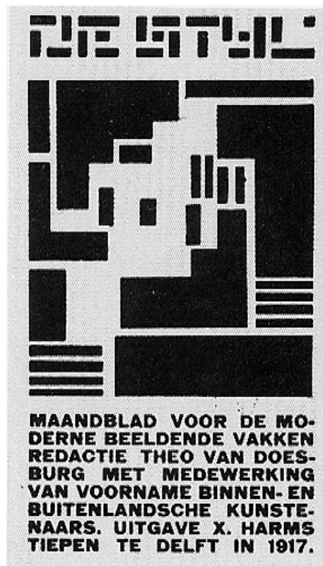
Figura 1 - Primeira capa da revista De Stijl . outubro de 1917.

Seguindo com a reflexão de Ronaldo Brito, é importante trazer uma atenção às diferenças políticas e produtivas que ecoam das tendências construtivas citadas anteriormente. Dessa forma, acompanhando o autor, faremos uma breve contextualização a respeito dos movimentos construtivos ocidentais. Faz-se necessário salientar que a tendência construtiva se caracterizou diretamente por suas relações com a política cultural dos estados. Começamos então com a revista De Stijl (Fig. 1) (1917), fundada por artistas holandeses, entre eles Mondrian, os quais tinham o intuito de desenvolver algo como um idioma universal da forma, baseando-se na estruturação vertical/horizontal, sem qualquer resquício de subjetividade. A elaboração das formas desses artistas ia no sentido contrário de qualquer realização idealista, a arte não era pensada como prática de conhecimento inserida em um quadro político, mas ia de encontro com um racionalismo formal.