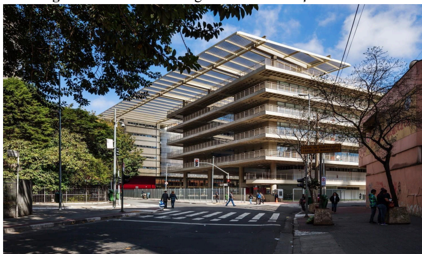
Figura 1: ETEC Santa Ifigênia vista da Praça Alfredo Issa